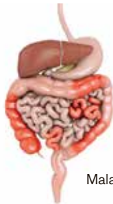
Maladie de Crohn

Malgré les recherches intensives, le facteur déclencheur de cette réaction reste encore inconnu à ce jour. Les thérapies sont certes de plus en plus efficaces, mais n'apportent toujours pas de guérison à l'heure actuelle. Les malades disposent d'une série de médicaments et peuvent s'appuyer sur la médecine complémentaire. Ces solutions permettent surtout de contenir l'inflammation et d'éviter l'apparition de complications. Des interventions chirurgicales peuvent être envisagées dans les cas graves. Les principales maladies inflammatoires chroniques intestinales sont la maladie de Crohn et la colite ulcéreuse.